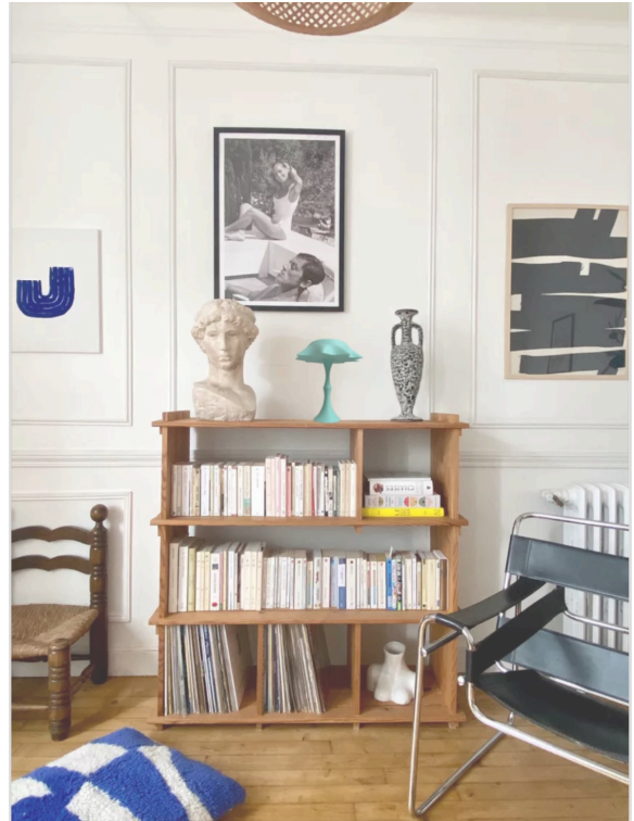
Selency, «Etagère bibliothèque en pin»