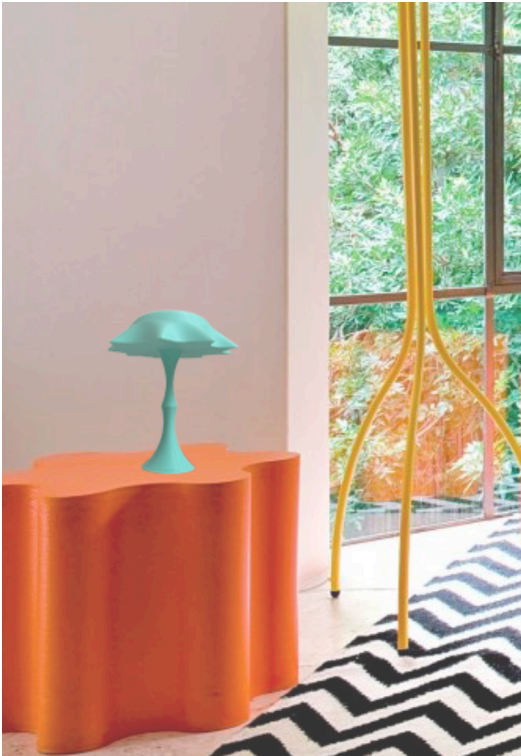
Marieclairemaison, Pinterest, «maison aux couleurs pop»